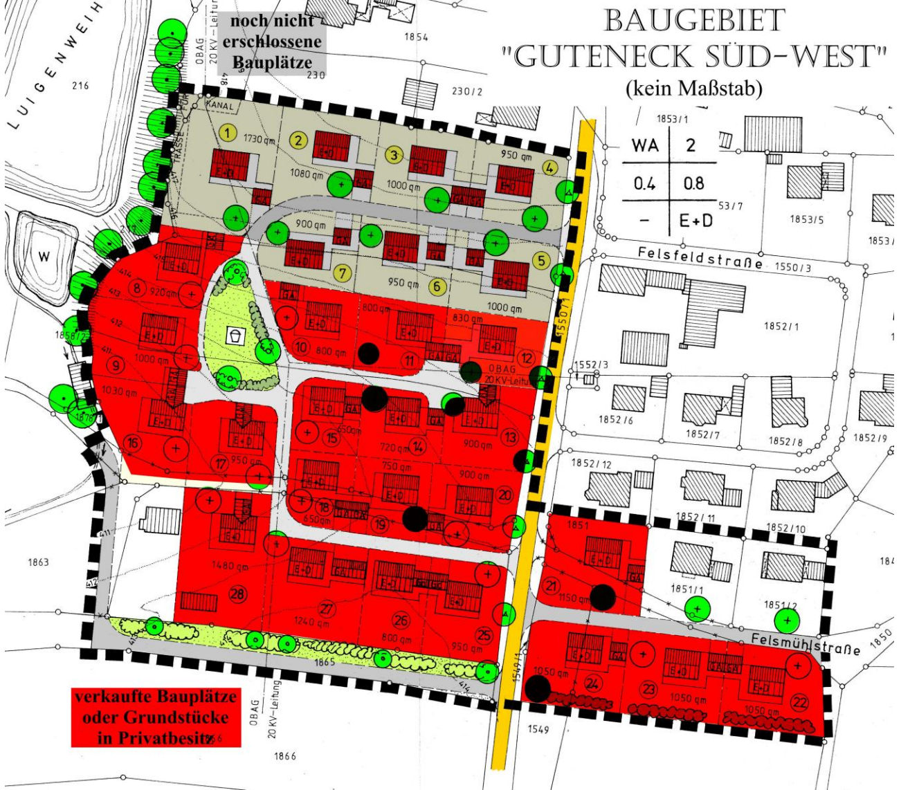
Lage des Baugebietes „Guteneck Süd-West“ in der Ortschaft Guteneck